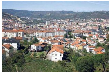
Vista de la ciudad de Ourense, desde Montealegre.