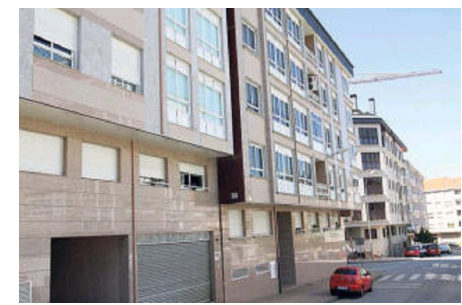
Los préstamos hipotecarios cubren un máximo del 80% de la vivienda y no incluyen impuestos.

IVÁN XIL - OURENSE La interdependencia entre la crisis del sistema financiero y las ventas del sector inmobiliario ha puesto el freno definitivo al mercado de viviendas. La drástica reducción del número de hipotecas concedidas durante el pasado mes de febrero en la provincia de Ourense cayó un 45,65% en tasa interanual, pasando de las 414 a las 189; según los datos publicados ayer por el Instituto Nacional de Estadística (INE).