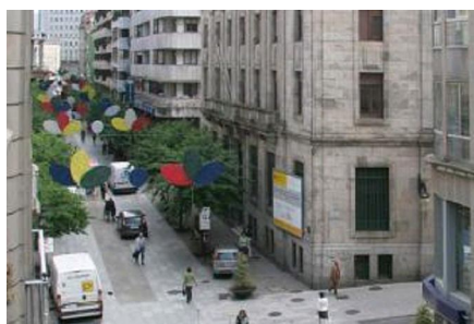
Vista de la calle del Paseo, una de las más caras de Ourense. Jesús Regal

M.J.ÁLVAREZ - OURENSE Los precios del mercado inmobiliario ourensano se estancan en el segundo trimestre de 2010, con un coste medio de 1.600 euros metro cuadrado construido. Mientras tanto en una de las calles de la milla de oro de la ciudad, el Paseo, se están construyendo ya pisos con precios récord de un millón de euros.