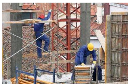
La compra-venta de vivienda nueva y usada se ha igualado.